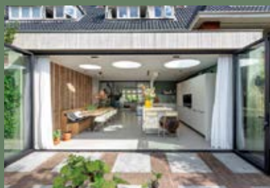
UITBREIDING WOONHUIS HAARLEM