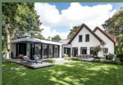
NIEUWBOUW VILLA IN BENTVELD