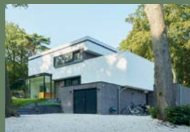
RENOVATIE VILLA IN BLOEMENDAAL